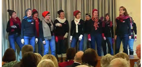
Von oben nach unten: Kirchenchor Cäcilia an St. Andreas Keldenich, Brigida Chor, Pop-Jazz-Chor „Zwischentöne, Rhubarbs