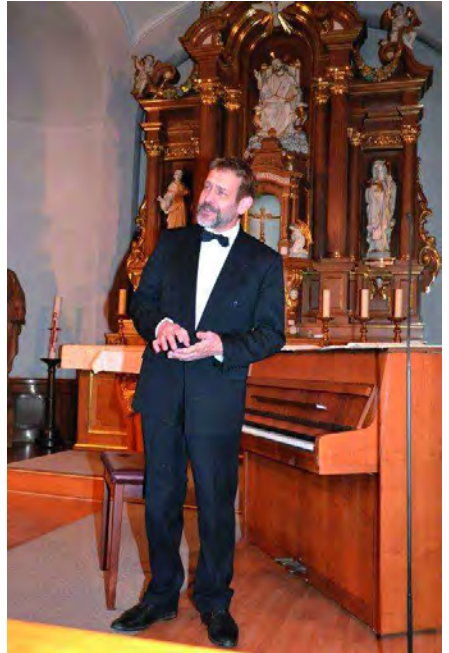
Kantor Lambert Kleesattel

van Beethovens (1770 – 1827), der von der musikinteressierten Welt im Jahre 2020 begangen wird und der 100. Todestag von Max Bruch (1838 – 1920) mit dem das Rheinland noch einen weiteren bedeutenden Musiker des Jahres vorzuweisen hat.